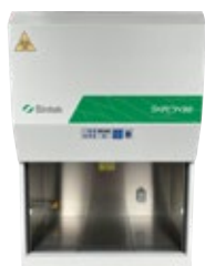
SKIRON BIOHAZARD - Classe IIA/B3

Per la manipolazione di prodotti sensibili alla contaminazione dell'aria ambiente, alla preparazione di terreni di coltura, ai controlli di sterilità, all'assemblaggio di apparecchi elettronici ed ottici, allestimento di soluzioni parenterali TPN e tecniche di fertilizzazione in vitro.