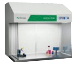
SKIRON HF Flusso laminare orizzontale

Per la manipolazione di prodotti sensibili alla contaminazione dell'aria ambiente, alla preparazione di terreni di coltura, ai controlli di sterilità, all'assemblaggio di apparecchi elettronici ed ottici, allestimento di soluzioni parenterali TPN e tecniche di fertilizzazione in vitro.