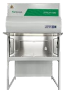
SKIRON S BIOHAZARD - Classe IIA

Per la manipolazione di farmaci citostatici e antitumorali, trattamento di polveri, oltre che per patogeni a basso/medio rischio biologico.