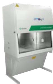
CYTO SKIRON BIOHAZARD - Classe IIA/B3

Per la manipolazione di patogeni a basso/medio rischio biologico.