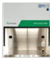
MINI SKIRON Flusso laminare verticale

Per la manipolazione di prodotti sensibili alla contaminazione dell'aria ambiente, alla preparazione di terreni di coltura, ai controlli di sterilità, all'assemblaggio di apparecchi elettronici ed ottici, allestimento di soluzioni parenterali TPN e tecniche di fertilizzazione in vitro.