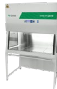
SKIRON VE BIOHAZARD - Classe IIA/B3

Per la manipolazione di microrganismi non patogeni o patogeni a basso rischio biologico.