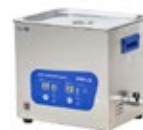
BAGNI DA LABORATORIO